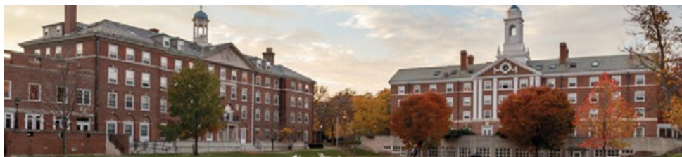
Instituto para Estratégia e Competitividade da Universidade de Harvard (Boston/Massachusetts-USA)

O programa MOC – Microeconomia da Competitividade, em parceria com a UNIALFA, tem como objetivo realizar estudos sobre a competência empresarial e competitiva de “clusters” de negócios na região Centro-Oeste, visando o desenvolvimento de pesquisas acadêmicas e casos para ensino. Faz parte de acordo da UNIALFA com o Instituto para Estratégia e Competitividade da Universidade de Harvard (Boston/Massachusetts-USA), liderado pelo professor emérito Michael Porter, cujo objetivo principal é explorar os determinantes da competitividade e do sucesso empresarial numa perspectiva econômica regional. Esta entidade congrega atualmente aproximadamente 100 universidades filiadas no mundo todo, que desenvolvem pesquisas sobre negócios locais, agrupados em “clusters” ou arranjos produtivos locais, utilizando metodologia de análise que considera não somente os fatores tradicionais de produção, como também o grau de exigência da demanda interna, a presença de setores correlatos e de apoio (governo, universidades, institutos de pesquisa), assim como a dinâmica competitiva das empresas existentes.